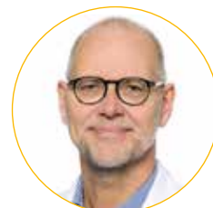
Prof. Dr. med. A. Dormann Kliniken der Stadt Köln gGmbH