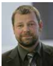
Hartmut Peitz Endoscope Complete Services GmbH & Co. KG Schöneberg