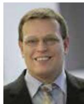
Olaf Krüger Endoscope Complete Services GmbH & Co. KG Schöneberg